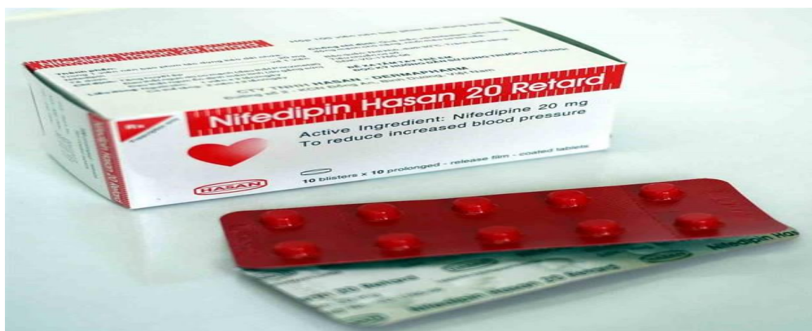
Thuốc sử dụng tại bệnh viện

Nifedipin là 1 thuốc chẹn kênh calci có mặt tại Úc với nhiều biệt dược khác nhau, bao gồm Adalat, Adefin, Addos và APO-Nifedipin.